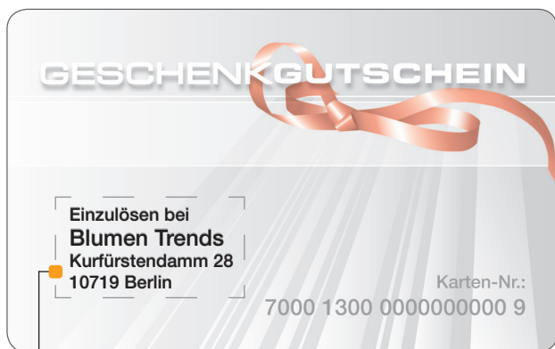
Beispiel für individuelle Gestaltung